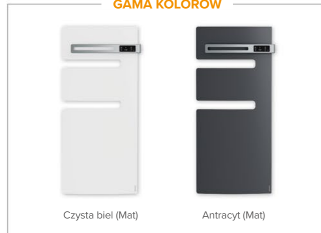
Czysta biel (Mat)