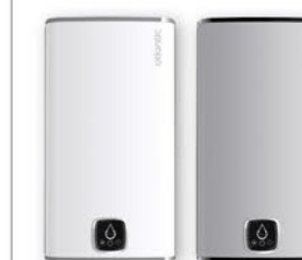
Biały (RAL 9016) Srebrny (RAL 9006)

* okres gwarancji jaką objęty jest zbiornik urządzenia